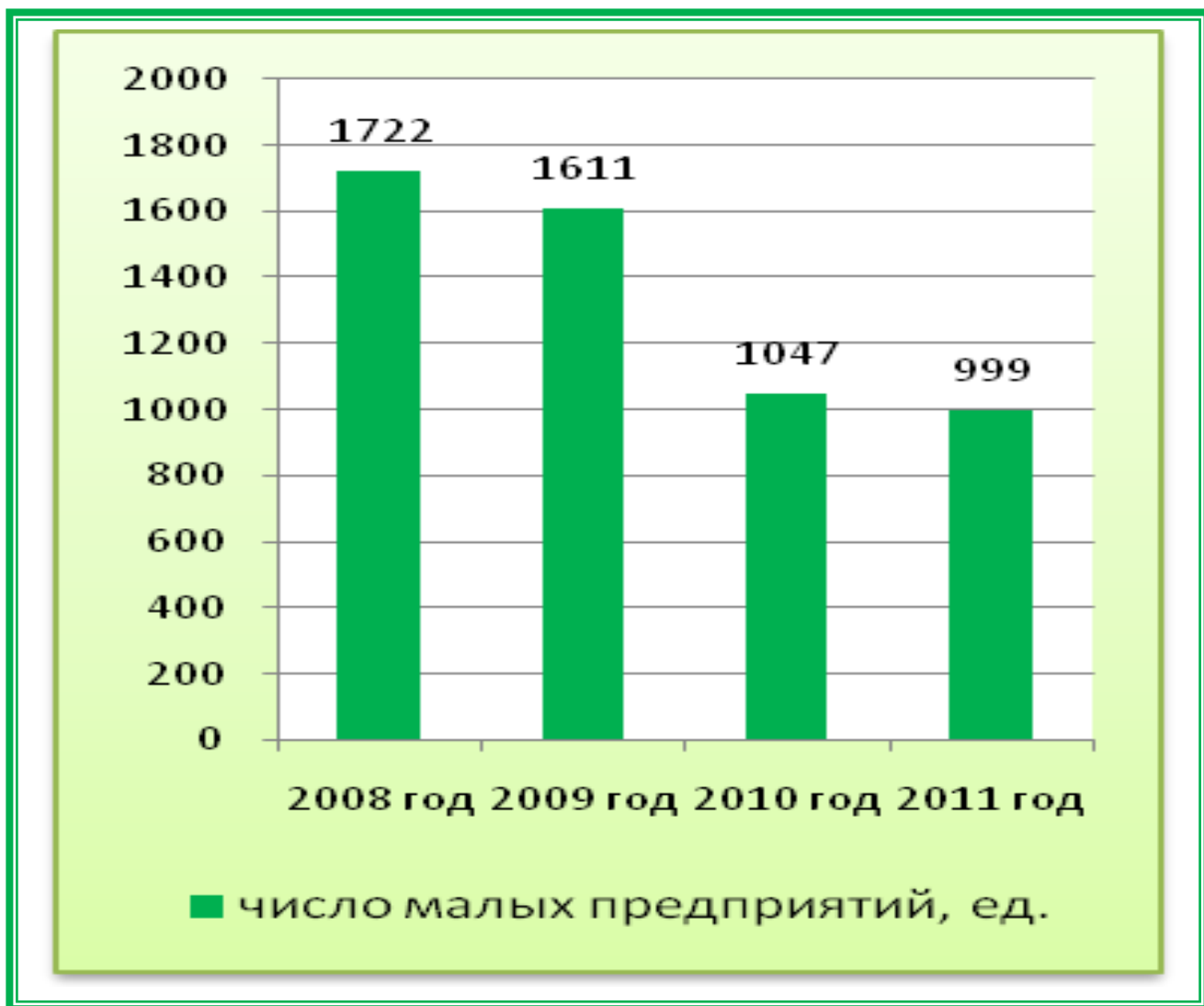
Рисунок 1 - Динамика числа действовавших малых предприятий Мурманской области с 2008-2011 г.г.

Наибольший удельный вес числа малых предприятий приходится на обрабатывающие производства, строительство, оптовую и розничную торговлю, операции с недвижимым имуществом. Так по состоянию на 2011 г. число малых предприятий в сфере строительства составило 115 единиц, чуть больше, а именно 141 единица приходится на малые предприятия, занятые в обрабатывающих производствах, на их долю приходится 14,11% от общего числа малых предприятий. На долю предприятий оптовой и розничной торговли приходится 33,13%, а это 952 единицы. Другие сферы деятельности