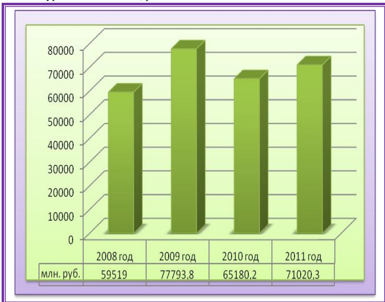
Рисунок 4- Динамика товарооборота малых предприятий Мурманской области с 2008-2011 г.г.

Оборот малых предприятий Мурманской области по состоянию на 2011 г. составил 71020,3 млн. руб., тогда как в 2008 г. этот показатель составил 59519, 0 млн. руб.т.е. наблюдается ежегодный рост товарооборота малого бизнеса Мурманской области, рис.4.