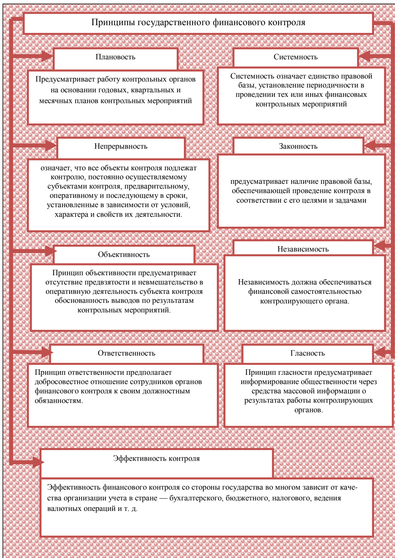
Рисунок 1.2- Принципы государственного финансового контроля