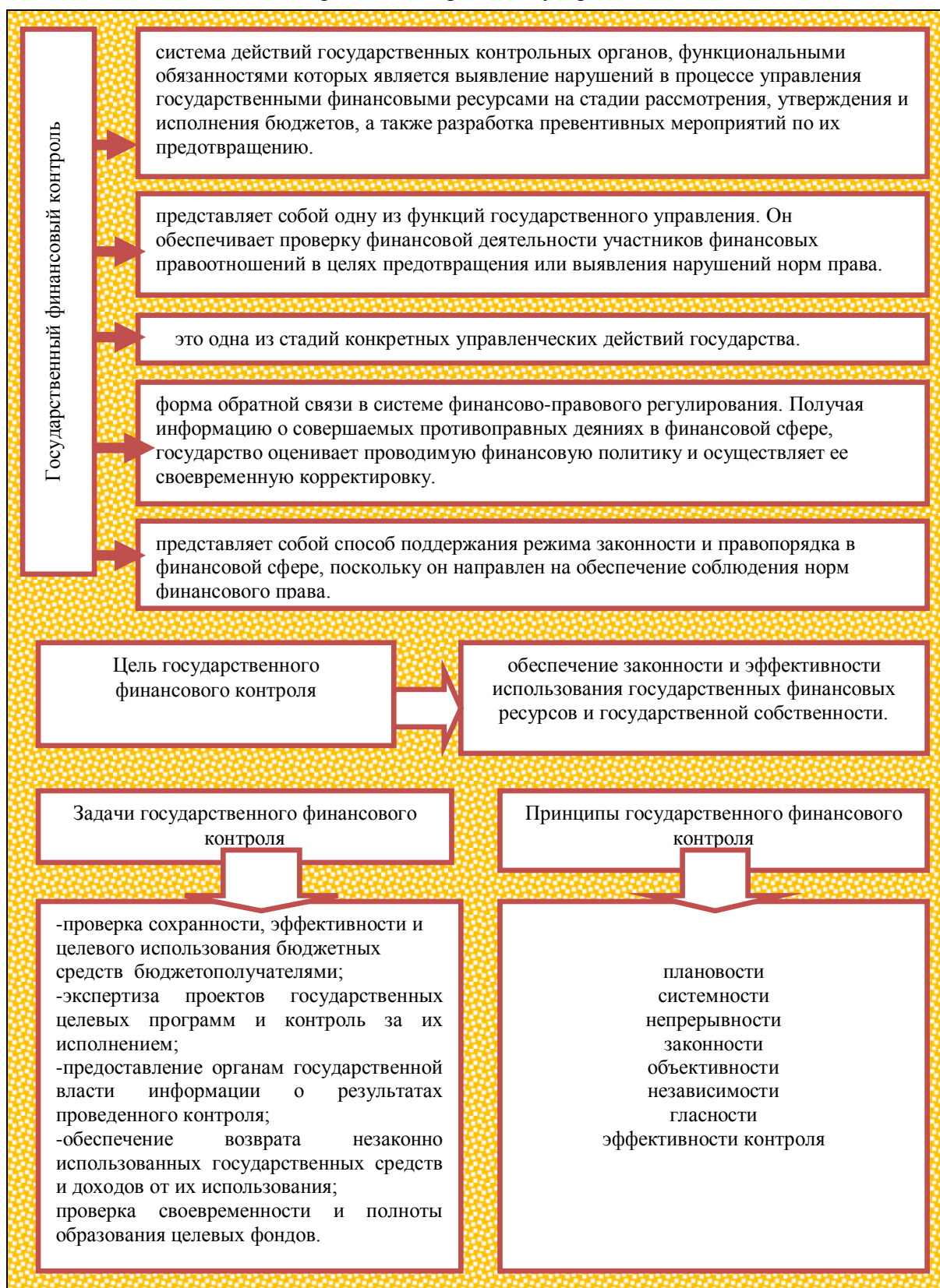
Рисунок 1.1- Понятие и принципы государственного финансового контроля.

государственных заказов, получателями бюджетных средств и налоговых льгот, и в этом отношении они также подлежат контролю со стороны государства.