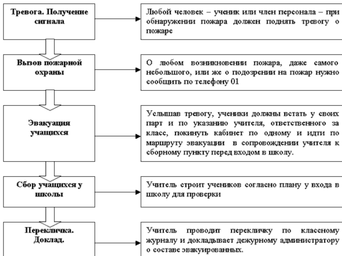
Рис.2.Алгоритм действий при экстренной эвакуации учащихся из кабинетов школы во время уроков.

должностным лицам в ОУ, ответственным за эвакуацию людей из здания школы целесообразно применять предлагаемую простую и эффективную процедуру эвакуации при пожаре. Эту процедуру эвакуации нетрудно применить в большинстве школ. Последовательность действий персонала и учащихся школы разбита на 5 этапов (рис.2):