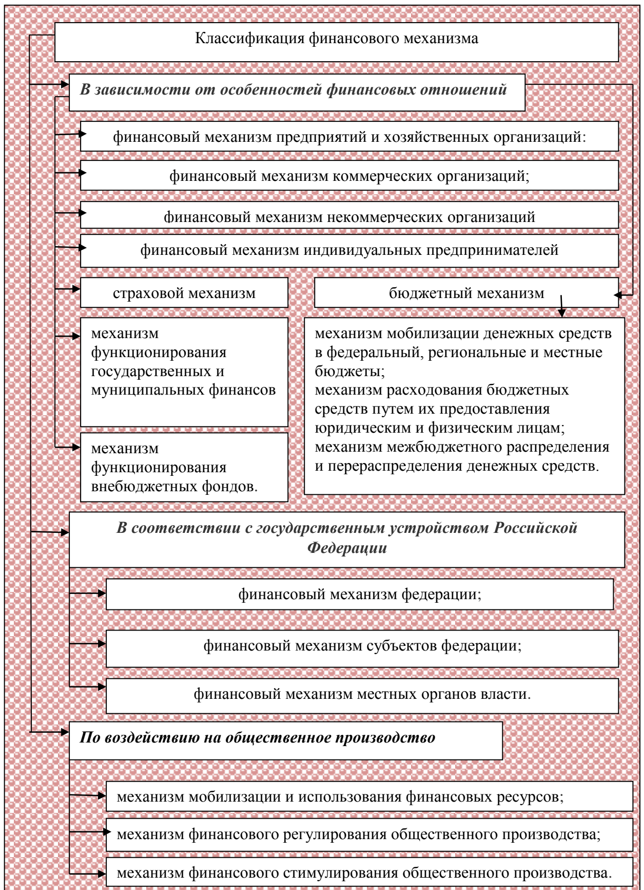
Рисунок 1.3 Классификация финансового механизма