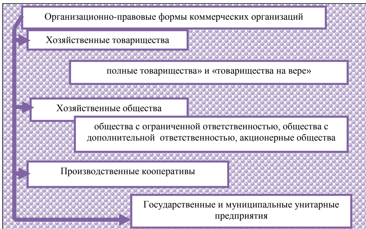
Рисунок 1.1. Организационно-правовые формы коммерческих организаций