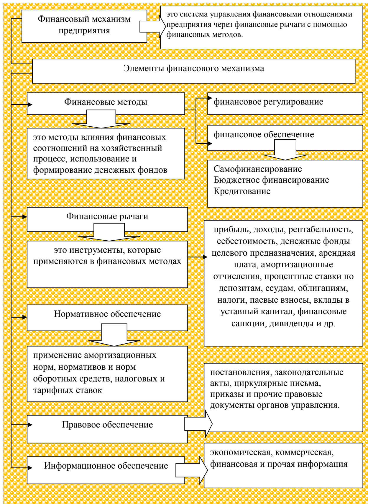
Рисунок 1.2. Элементы финансового механизма