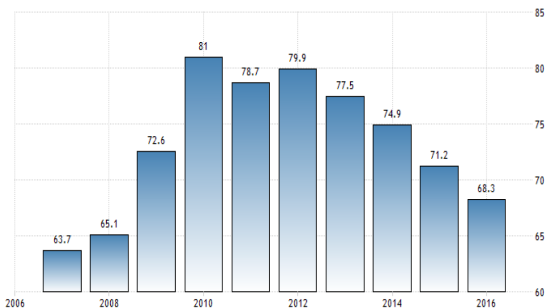
Рисунок 1. Германия - Государственный долг к ВВП 2

Динамика государственного долга к ВВП страны последние годы демонстрирует снижение, рисунок 1.