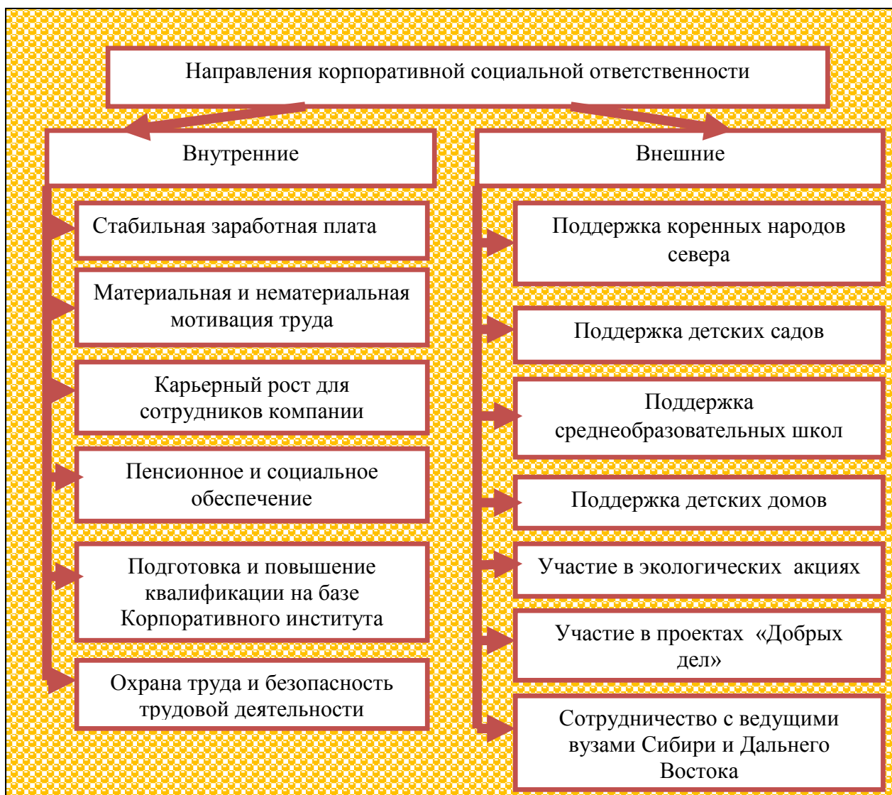
Рисунок 4.1 - Направления корпоративной социальной ответственности компании ООО «Газпром трансгаз Томск»

и самосовершенствованию, ответственности, высокой производственной культуре.