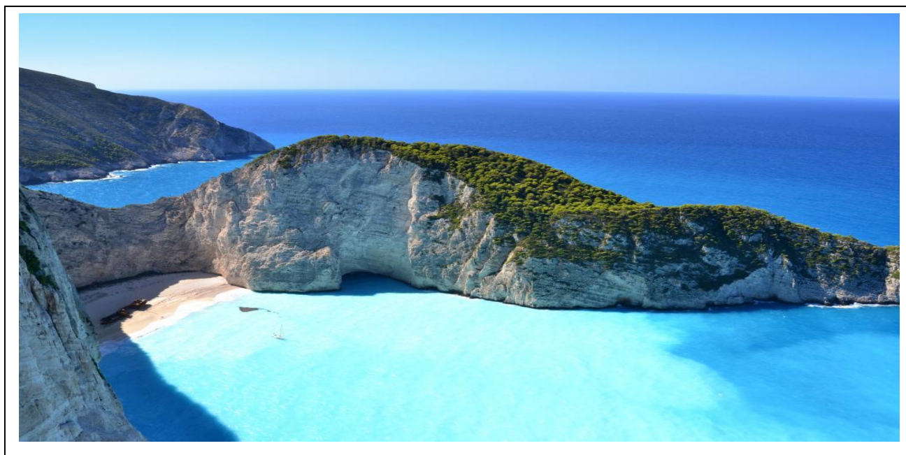
Рисунок 2.9-Остров Закинф на Ионическом побережье Греции

2)Остров Закинф. Закинф – настоящая жемчужина в короне Ионических островов, рисунок 2.9.