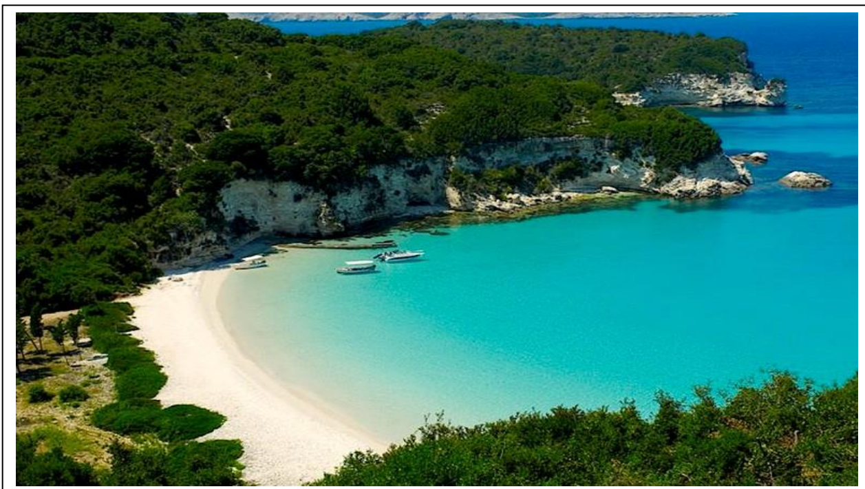
Рисунок 2.10-Остров Пакси на Ионическом побережье Греции

3)Пакси. Остров Пакси также называют Паксос, рисунок 2.10.