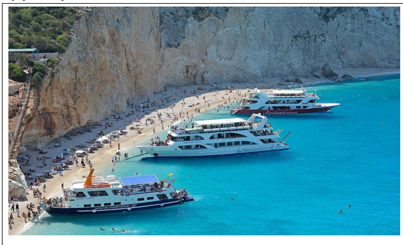
Рисунок 2.14-Остров Лефкада на Ионическом побережье Греции

7)Остров Лефкада. Остров богат как природными, так и рукотворными достопримечательностями, рисунок 2.14. Одной из главных природных достопримечательностей Лефкады считаются каскадные водопады Нидри. Особенно популярен среди туристов Димоссари. Недалеко от Нидри есть одноимённая долина с мистическими курганами и остатками старых домов. Настоящей достопримечательностью Лефкады стал пляж Эгремни. Возле пляжа Айос-Иоаннис можно остановиться возле небольшой часовни Андзуси. Она построена на скале в XVI в. и является старейшей церковью Лефкады, а также сохранила историческую колокольную. Среди верующих часовня особо почитаема: считается, что недалеко от современной церкви когда-то проповедовал апостол Павел. Внутри есть редкие византийские иконы.