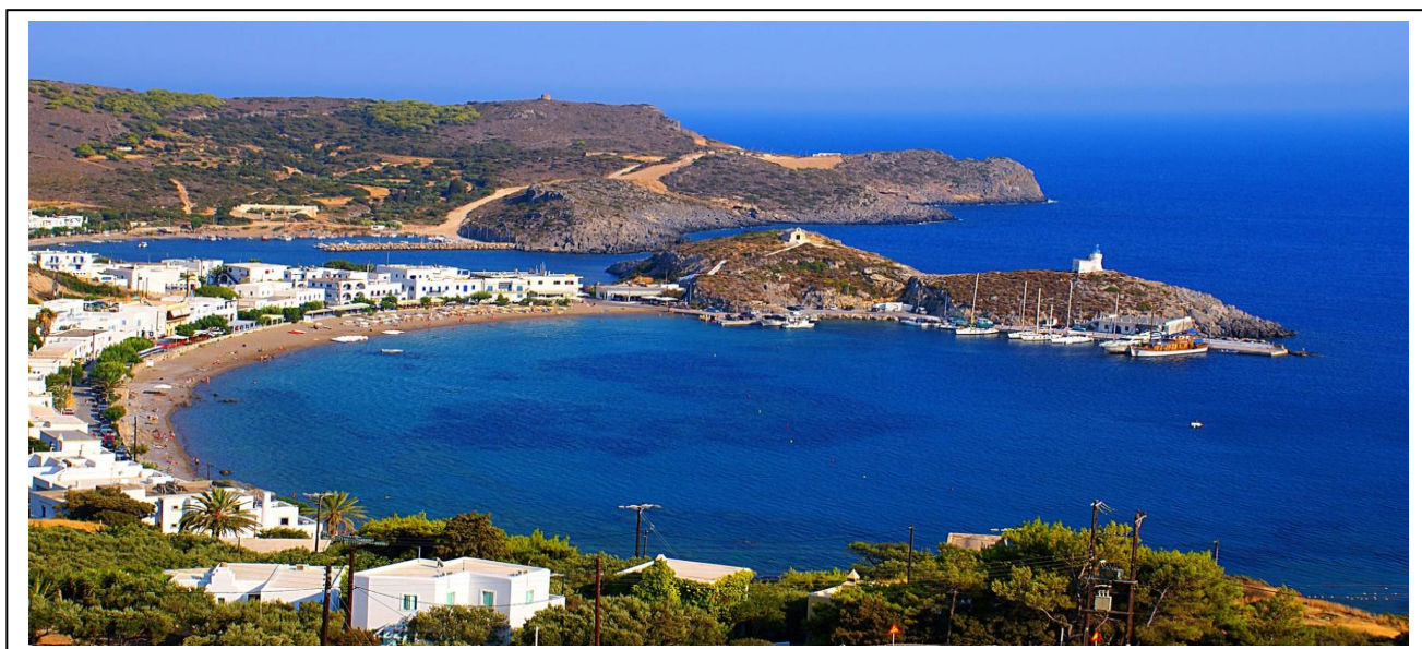
Рисунок 2.11-Остров Китира на Ионическом побережье Греции

4) Остров Китира. Китира находится у берегов Пелопоннеса, в том месте, где Эгейское море встречается с Ионическим, рисунок 2.11.