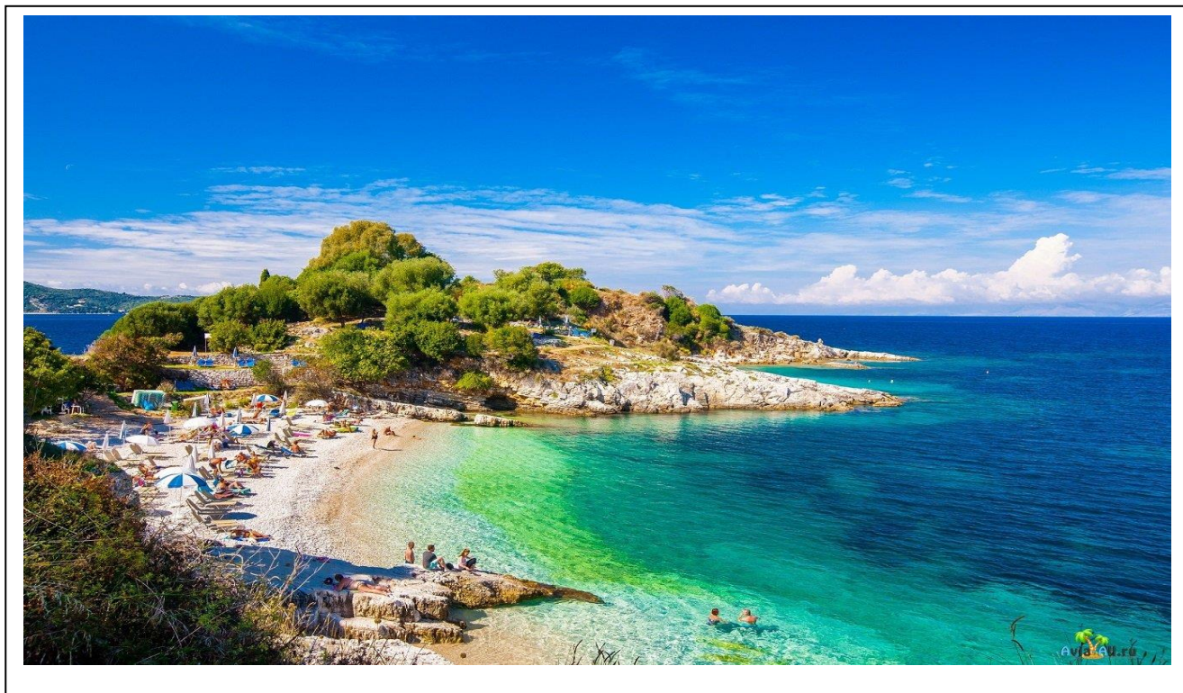
Рисунок 2.8- Остров Корфу на Ионическом побережье Греции

1)Остров Корфу. Зелёный остров Корфу лидирует по предпочтению туристами среди Ионических островов. Столица острова – город Керкира. Корфу предоставляет своим гостям огромное разнообразие способов хорошо провести время, рисунок 2.8.