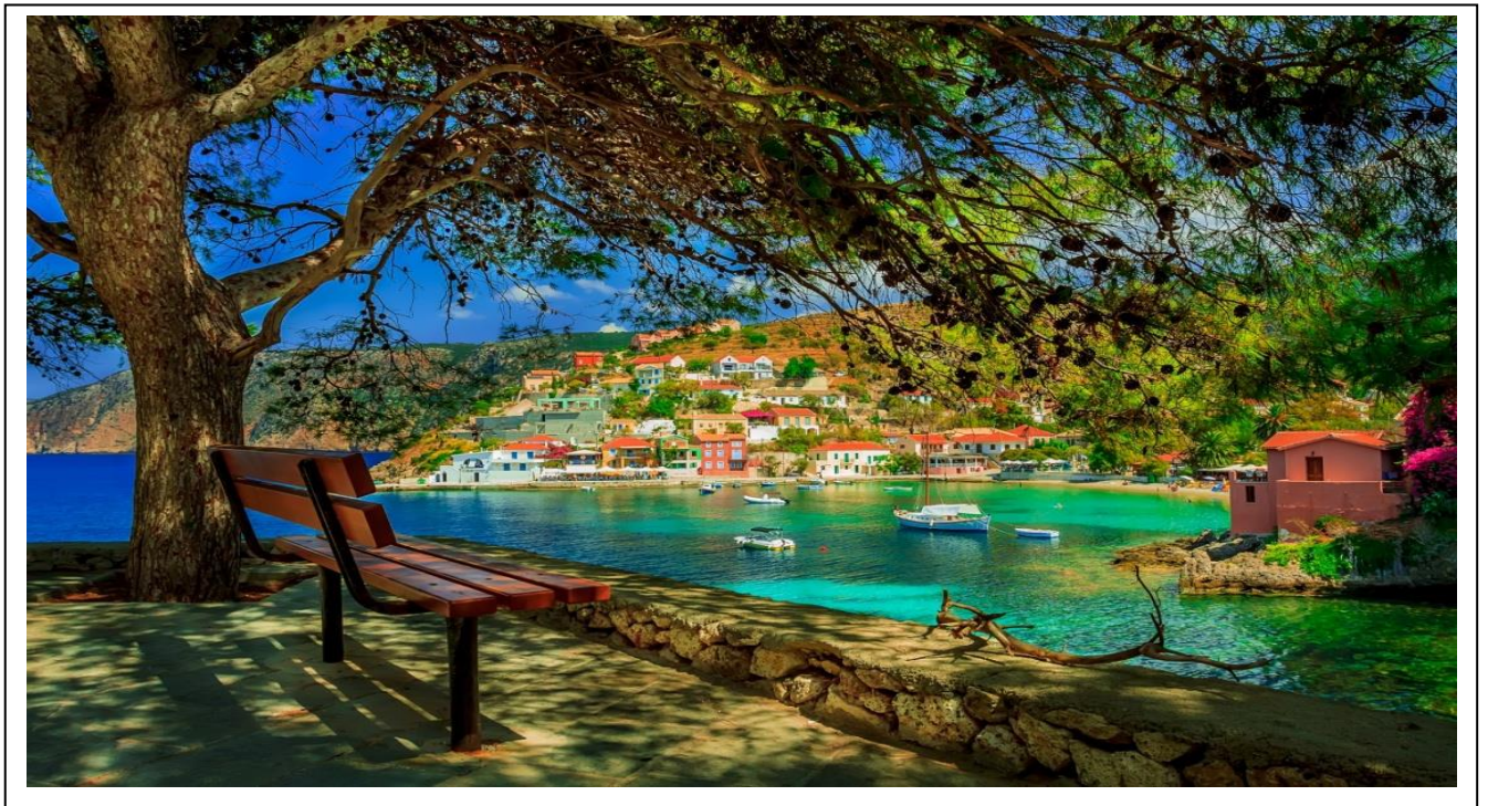
Рисунок 2.13-Остров Кефалония на Ионическом побережье Греции

б)Остров Кефалония. Кефалония находится ровно посередине Ионического моря. Это самый большой из Ионических островов. Его площадь составляет 786 км 2 . Столица – город Аргостоли. Остров популярен среди любителей пляжного отдыха, рисунок 2.13.