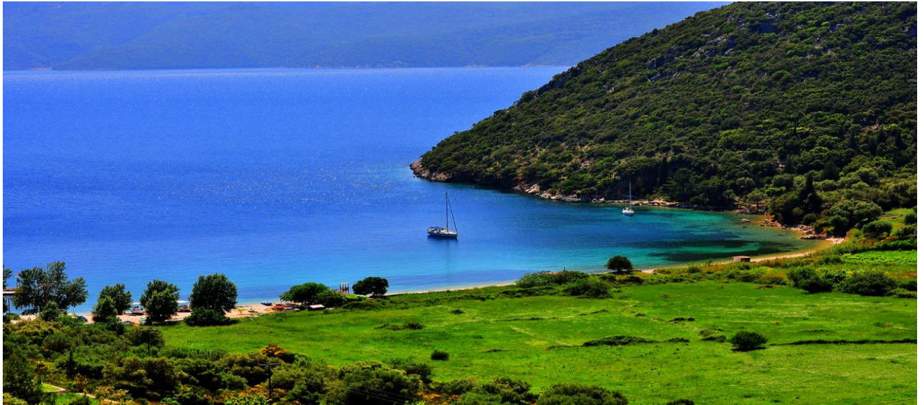
Рисунок 2.12-Остров Итака на Ионическом побережье Греции

б)Остров Кефалония. Кефалония находится ровно посередине Ионического моря. Это самый большой из Ионических островов. Его площадь составляет 786 км 2 . Столица – город Аргостоли. Остров популярен среди любителей пляжного отдыха, рисунок 2.13.