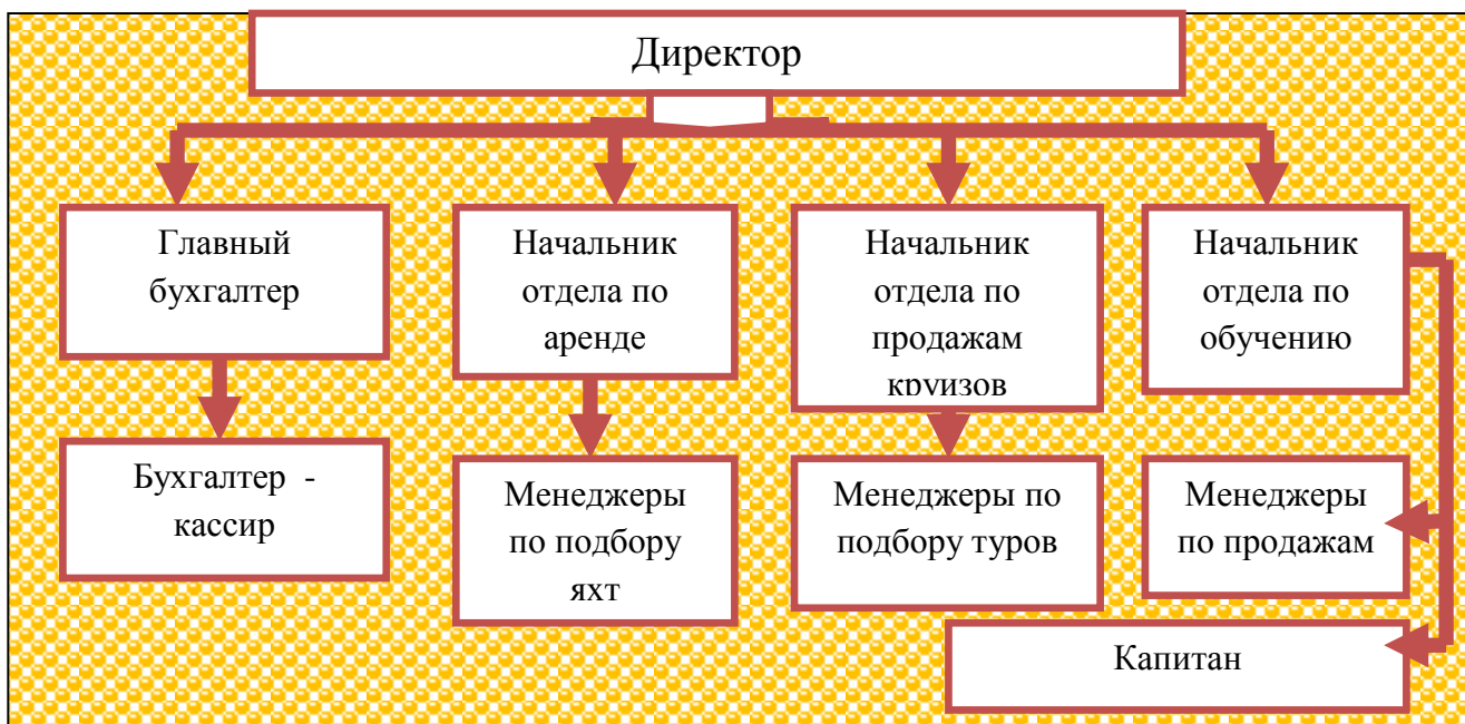
Рисунок 1.1- Организационная структура управления ООО «12 узлов»

поручения туроператору; принимает все претензии, которые возникли у туриста, решает их путем переговоров с клиентом и туроператором; своевременно информирует бухгалтерию о необходимости выставления счетов для оплат по безналичному расчету.