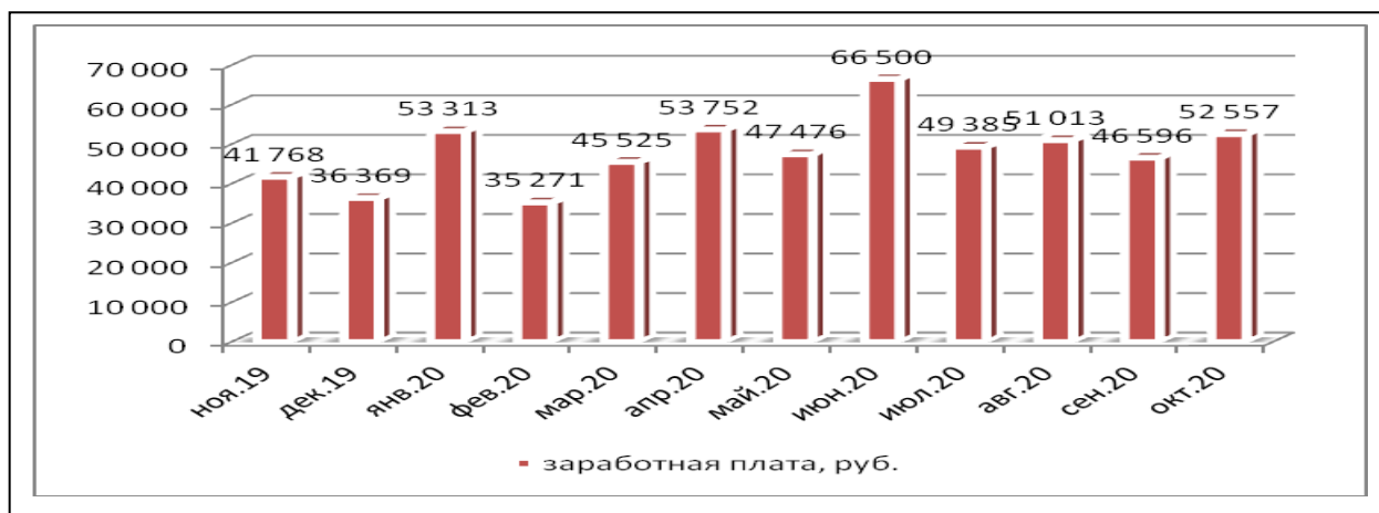
Рисунок 1. Уровень средней зарплаты за последние 12 месяцев: «Адвокат в России» [6]