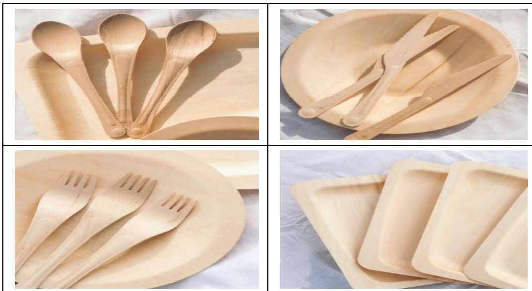
Рисунок 1. Основной ассортимент компании ООО «Экоарми»

В ассортименте продукции одноразовые вилки, ложки, ножи, размешиватели для горячих напитков, тарелки, шпатели косметологические, рисунок 1. Цены на ассортимент компании представлены в Приложении 1.