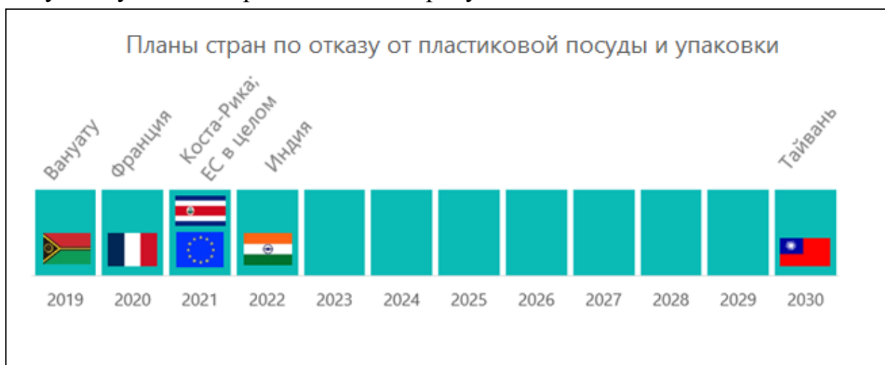
Рисунок 4. Планы стран по отказу от пластиковой посуды и упаковки[8]

По данным Verified Market Research, мировой рынок биоразлагаемой посуды в 2018 году оценивался в 2 754,9 млн. долл. Ожидается, что к 2025 году он вырастет до 4 355,1 млн. долл., т. е. более чем в 1,5 раза. Этому способствуют жесткие меры по отказу наиболее развитых стран от одноразовых пластиковых предметов. Планы стран по отказу от пластиковой посуды и упаковки представлены на рисунке 4.