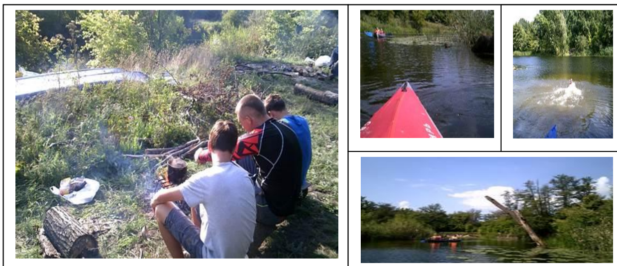
Рисунок 3- Фото второго дня маршрута

Расстояние – 24 км. Фото второго дня представлено на рисунке 3.