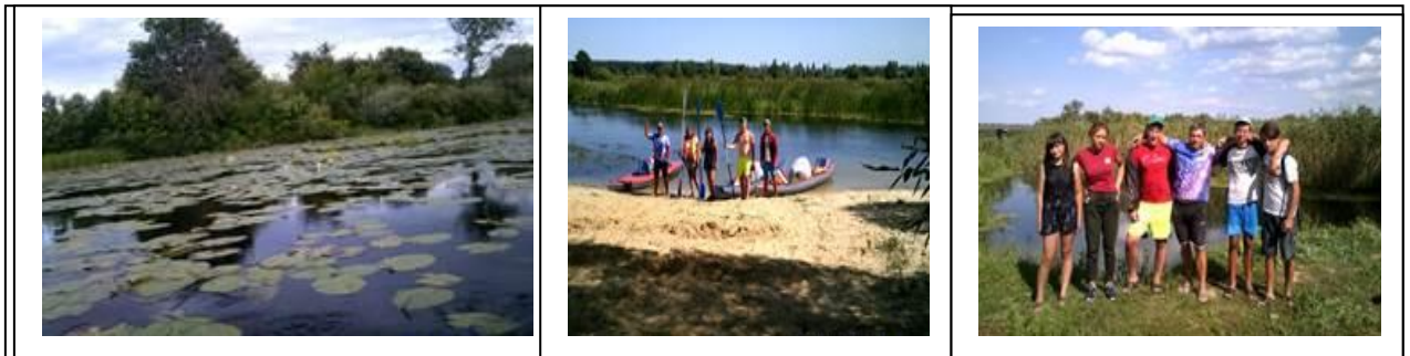
Рисунок 6- Фото шестого дня маршрута

Триста лет назад долина реки Битюг разделялась на 12 владений - юртов. Одно из таких владений в 25 верстах выше устья Битюга в 1660-е годы взял в откуп воронежец Назар Шестаков. За владением закрепилось название - Шестаков юрт.