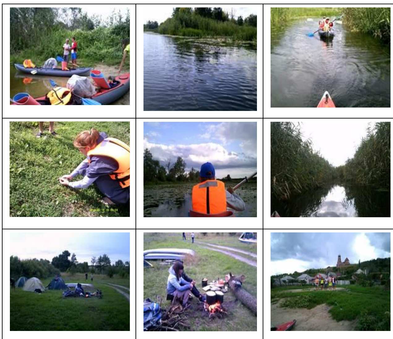
Рисунок 5- Фото четвертого дня маршрута

Расстояние – 15 км. Фото четвертого дня представлено на рисунке 5.