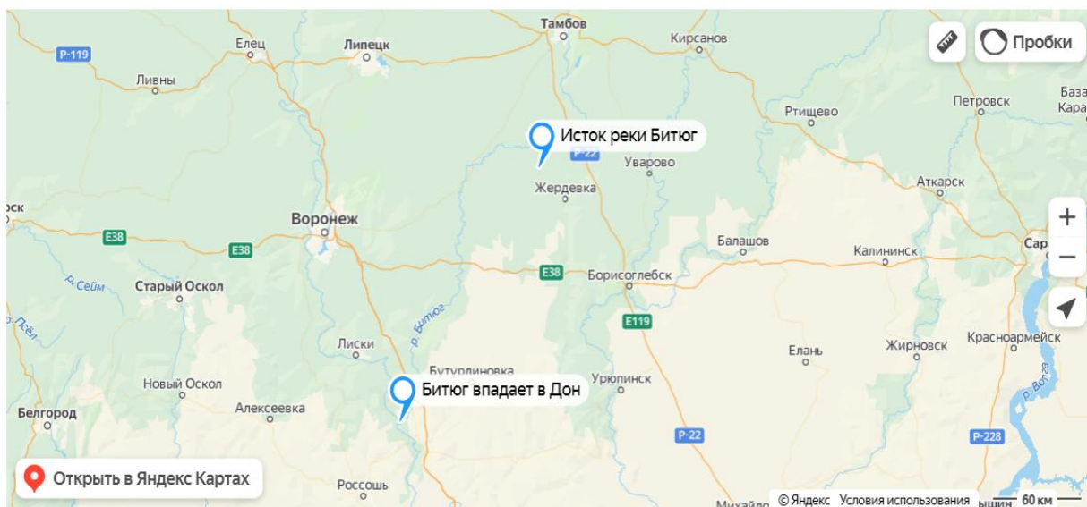
Рисунок 1- Река Битюг на карте

Битюг - это левый приток реки Дон. Протекает по территориям Воронежской, Тамбовской и Липецкой областей. Речка эта популярна среди рыбаков и особенно любителей сплавляться по воде на байдарках. Это и не удивительно - река протекает по живописным просторам области. Река Битюг на карте представлена на рисунке 1.