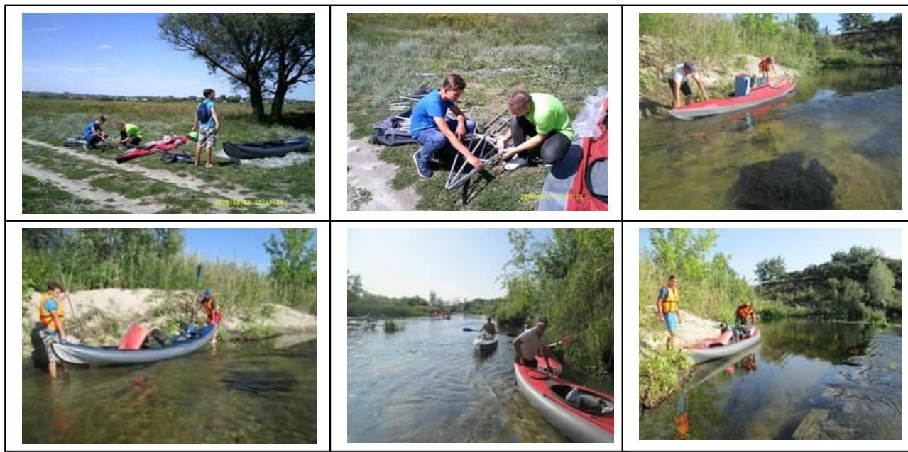
Рисунок 2- Фото первого дня маршрута

Расстояние – 7 км. Фото первого дня представлено на рисунке 2.