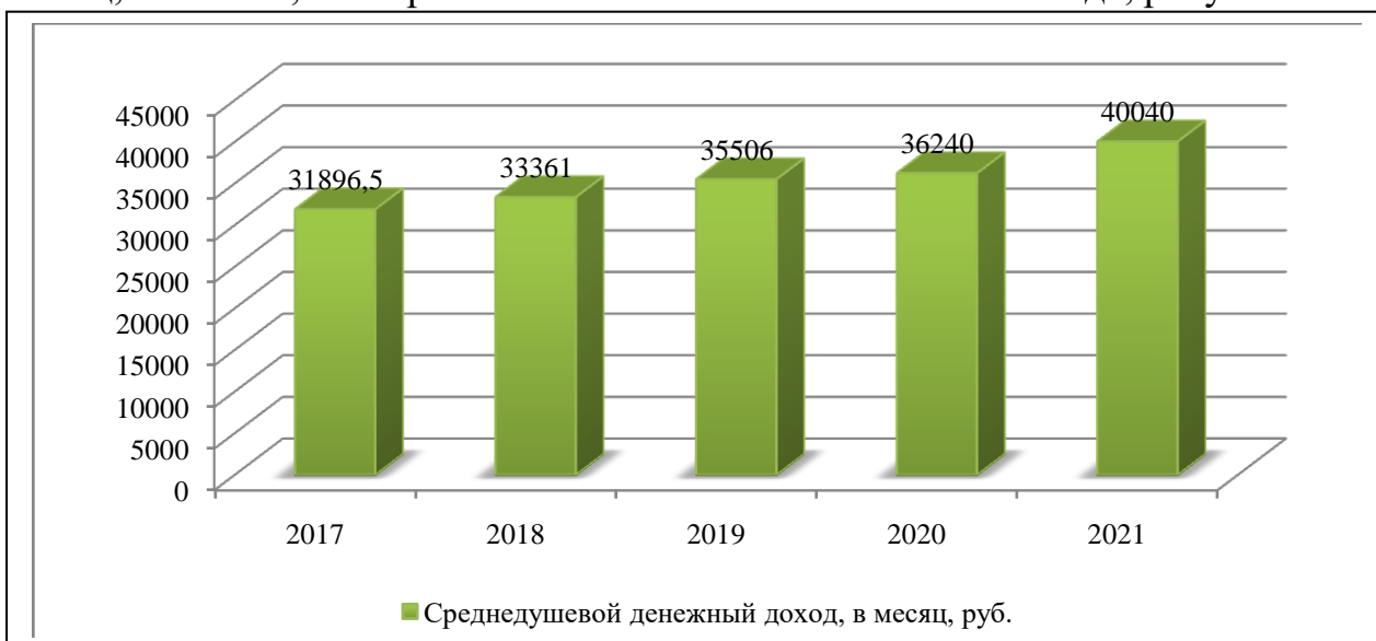
Рисунок 2.4-Динамика среднедушевого денежного дохода населения в России с 2017-2021гг. [15]

Среднедушевой денежный доход всего населения России в 2021 году увеличился на 10,48% к уровню прошлого года и составил 40040,0 руб. в месяц, это на 25,53% превышает значение показателя 2017 года, рисунок 2.4.