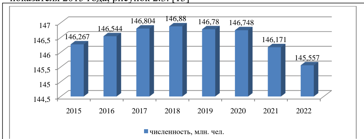
Рисунок 2.3- Динамика численности населения России с 2015-2022гг. (на начало года) [15]

Итак, выше было рассмотрено влияние санкций и военного конфликта - 2022 года на российскую экономику. В продолжении темы рассмотрим динамику численности, реальных доходов населения в динамике по данным Росстата. По данным на январь 2022 года численность населения составила 145,557 млн. человек, это ниже, чем годом ранее на 0,42% и на 0,48% ниже показателя 2015 года, рисунок 2.3. [15]