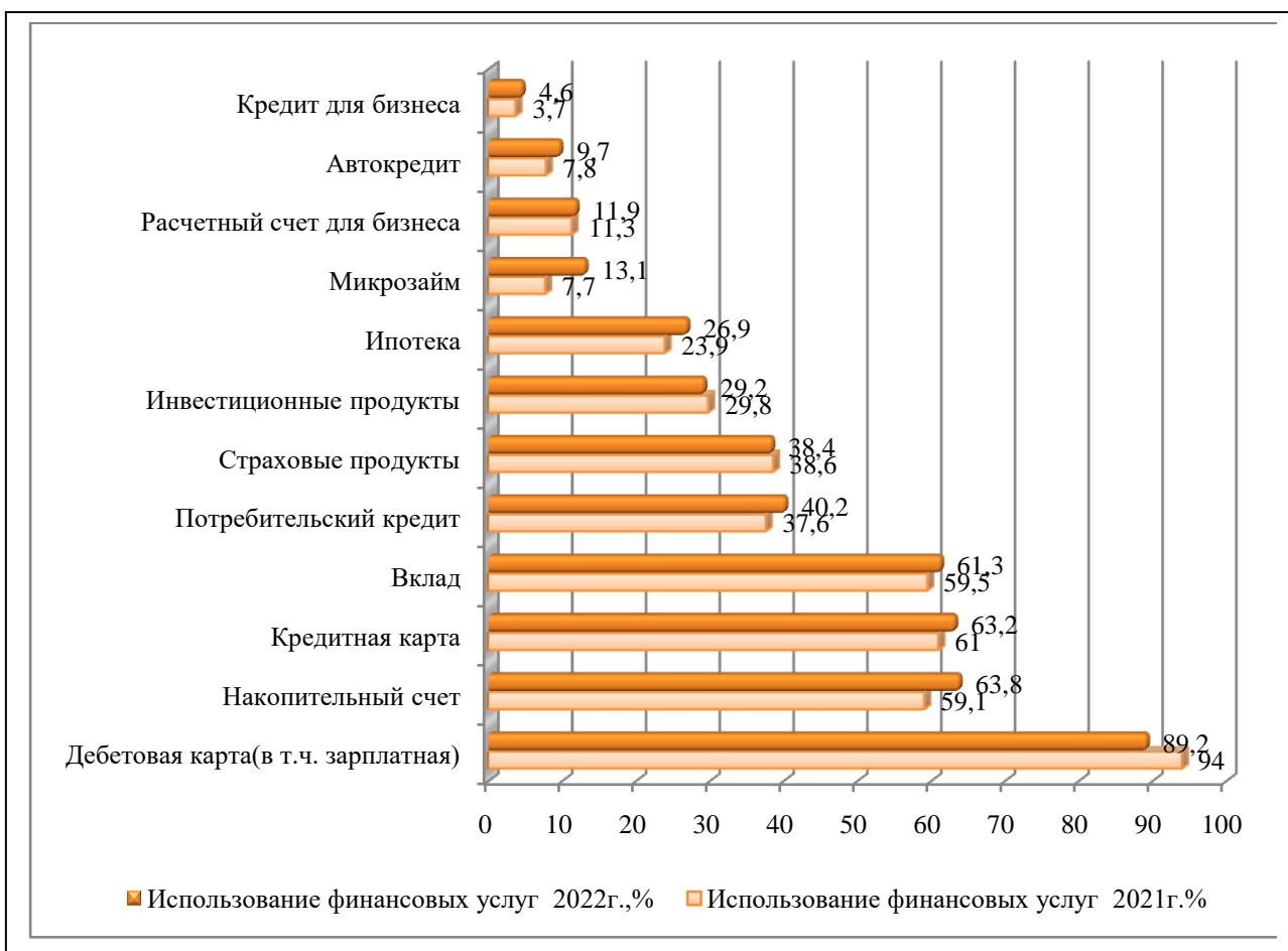
Рисунок 2.3-Услуги пользующиеся спросом на финансовых маркетплейсах в 2021-2022гг. [16]

Для продвижения кредитных продуктов ПАО «Сбербанк России» использует также финансовые маркетплейсы. Для того, чтобы подробнее описать особенности кредитования юридических лиц в Сбербанке, перейдем к следующей части курсовой работы.